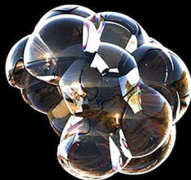
bulles de savon