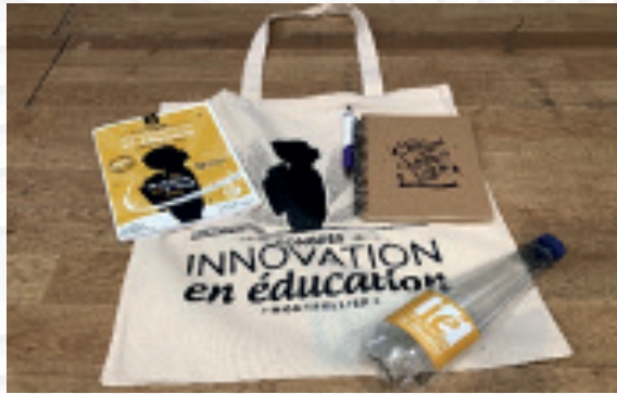
3ème Congrès en Innovation (Montpellier - Mars 2020)