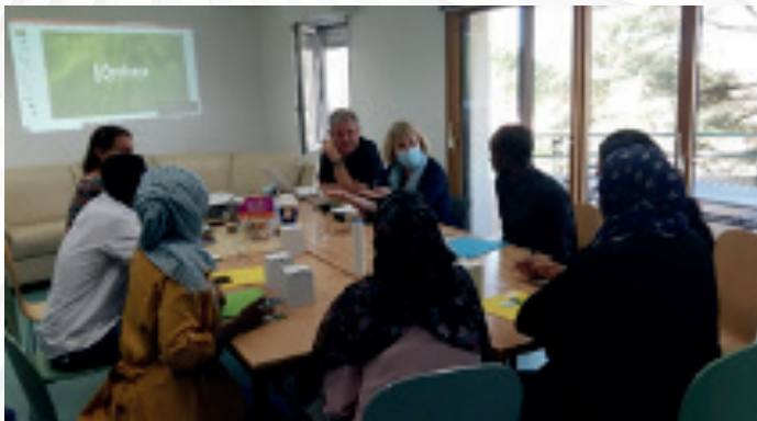
Accompagnement à l'emploi avec la Fondation Agir contre l'Exclusion (Face Vendée - Juillet 2020)