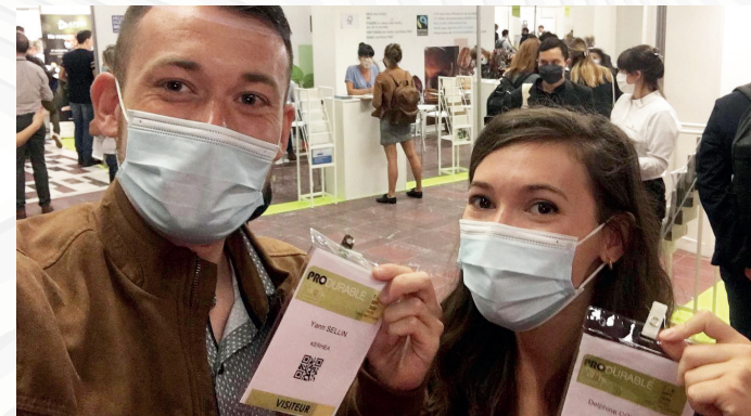
Salon Produrable Paris (Septembre 2020)