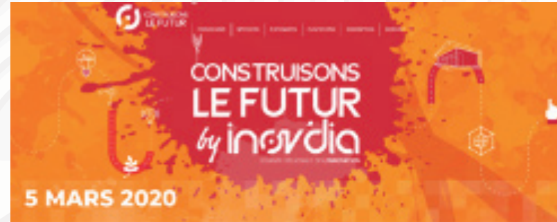
Forum Inov'Dia (Mars 2020)